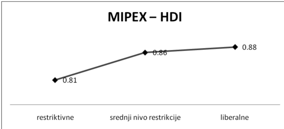
Графикон 2: Зависност имиграционе политике од Хуманог људског развоја