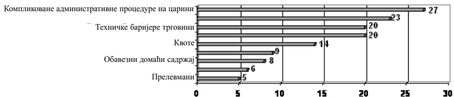
Графикон 2: Најзначајније нецаринске баријере у међународној трговини по оцени привредника Војводине